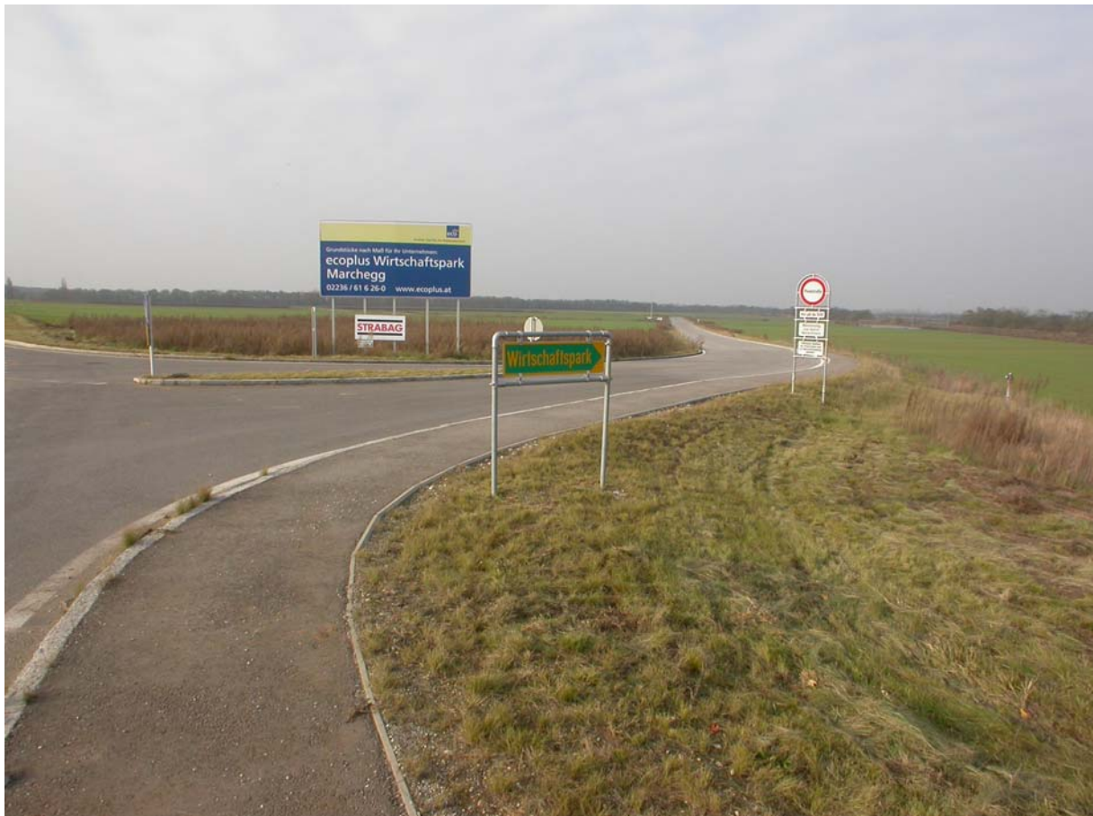
Abbildung: „Stranded Investment“ Wirtschaftspark Marchegg am 31.10.2005

Der Umweltbericht führt unter „aktuelle Planungsabsichten ab Seite 29 mehrere Planungsvorhaben unter Bezug auf (der Erfahrung nach allgemein gehaltene) Medienberichte an , die alle gemeinsam haben, das sie noch nicht als hinreichend konkret gelten können. Besondere Erwähnung muss hier noch der ebenfalls angesprochene Wirtschaftspark Marchegg (UB S.29) finden, der im Umweltbericht fälschlicherweise als aufgeschlossen bezeichnet wurde, was nur für einen Teil der zu stolzen Preisen angekauften 42 ha der Fall ist.